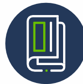
RIVISTE E FASCICOLI