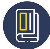
RIVISTE E FASCICOLI